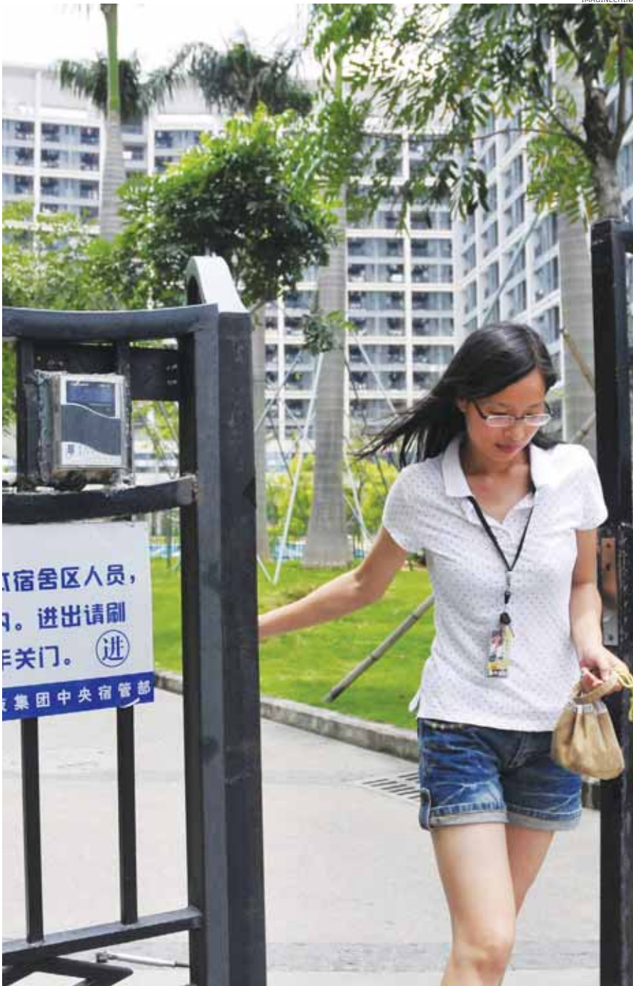
Se il cancello si apre. Una ragazza lascia l'area dormitorio della Foxconn a Shenzhen

«Si ripeterà quanto già accaduto in passato a Taiwan o in Corea: le produzioni a basso valore aggiunto si sposteranno in paesi ca-